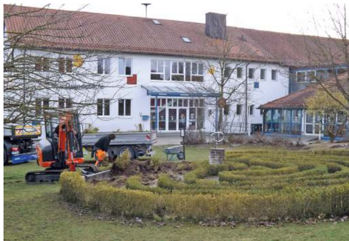
Aufgrund des Befalls des Buchsbaumzünsler mussten die fast 20 Jahre alten Buchsbäumchen von den Bauhofmitarbeitern auf dem Schulhof der Grundschule entfernt werden.