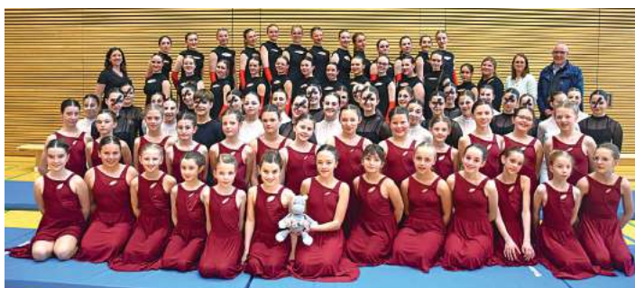
Stolz und überglücklich zeigten sich die Tänzerinnen des Ringeisen-Gymnasiums über die großartigen Platzierungen beim Regionalwettbewerb in Gersthofen.