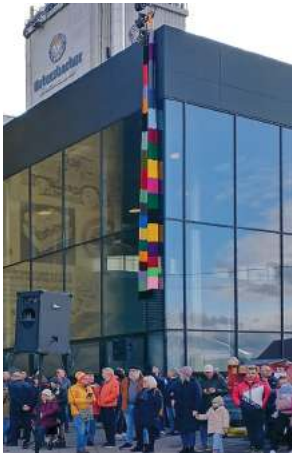
Ein überdimensionaler Schal auf seiner Reise