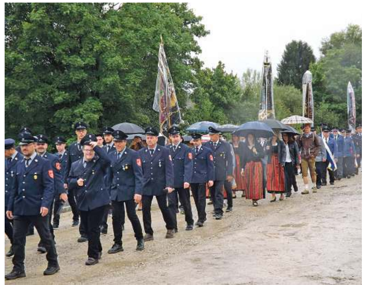
Auf gutes Wetter ohne Regen hoffen alle Feuerwehrvereine für ihre Feste

Konradshofen, 19. bis 21. Juni: In Konradshofen beginnen die Feierlichkeiten mit einem Partyabend am Freitag mit der Band „Solid Age“. Bereits am Samstag gibt es einen Festumzug und abends können sich Gäste auf einen Mix aus fetziger Blasmusik und Showelementen von der Band „Humpa Bumpa Revolution“ freuen. Am Sonntag zeigt nach Gottesdienst und Mittagstisch die Feuerwehr aus Schwabmünchen ab 14 Uhr Show-Übungen und die Jugendkapelle lässt spätnachmittags das Fest ausklingen. Ein besonderer Höhepunkt wird für die Gäste die Verlosung von fünf Rundflügen über die Stauden und Schloss Neuschwanstein sein.