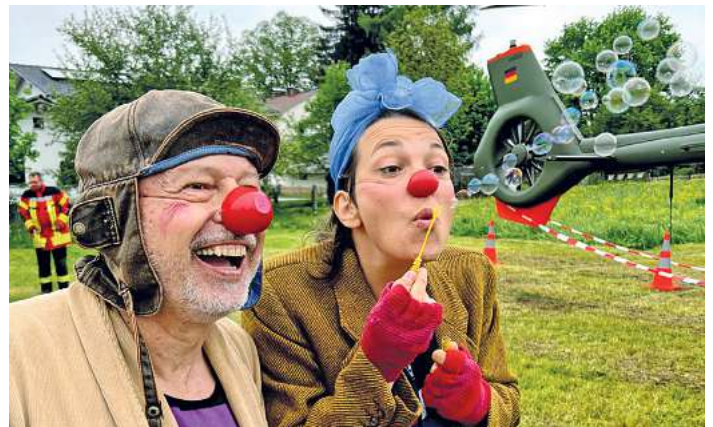
Die Clowns bei Gänseblümchenfest

Für Unterhaltung sorgt ein buntes Rahmenprogramm mit Tombola, Beiwagenfahrten auf dem Motorrad, Clown-Auftritten, Kinderschminken und römischen „Legionären“, die mit den Kindern durch den Kinderhospiz-Garten „patrouillieren“. Ein besonderes Highlight ist gegen 13.30 Uhr die Landung des SAR-Hubschraubers der Bundeswehr.