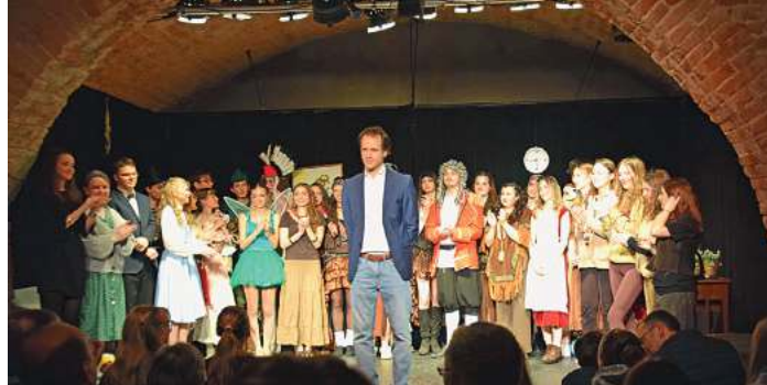
Der Oberstufenkurs „Theater und Film“ am Ringeisen-Gymnasium hat unter der Regie und Leitung von Sebastian Eberle das Stück „Peter Pan“ in einer vergnüglich bunten Inszenierung auf der Bühne des Kellertheaters gebracht.

Mit dem Verweis auf das Peter Pan-Syndrom greift der Kurs auch im Programmheft den Wunsch nach realitätsverleugnender Kindheit ohne Verantwortungsübernahme auf und verweist auf die negativen Aspekte. Charakteristisch für dieses psychologischen Phänomen sind demnach Bindungsangst, Egoismus, Narzissmus, finanzielle Unselbständigkeit, Fokussierung auf die eigene Mutter, Chauvinismus und emotionale Unreife.