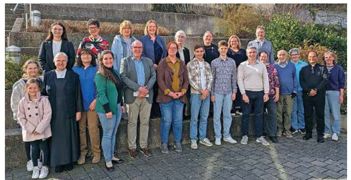
In diesem Schuljahr wurden mit dem Adventsbasar insgesamt 26.000 Euro an Spenden eingenommen, die im Rahmen einer kleinen Feierstunde an die verschiedenen Hilfsprojekte und deren Vertreter übergeben wurden.

Die Kriterien bei Jugend debattiert sind Sachkenntnis, Ausdrucksfähigkeit, Gesprächsfähigkeit und Überzeugungskraft. Es geht also nicht um Persuasion oder gar bloße Überredung, sondern um einen fairen Austausch über gesellschaftlich relevante Themen. Der Wettbewerb fördert rhetorische Kompetenzen und stärkt das Verständnis für demokratische Prozesse sowie die Bedeutung einer fundierten Diskussionskultur. Mit Blick auf die Gegenwart ist dies also nicht nur ein individueller, persönlicher Gewinn, sondern ein gesamtgesellschaftlicher Schritt in die richtige Richtung.