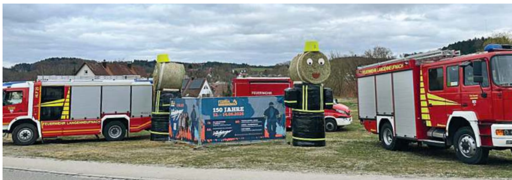
Mit einem Werbebanner und zwei riesigen Heuballen-Feuerwehrfiguren wirbt der Feuerwehrverein für sein Jubiläumsfest.

In den 1960er Jahren kaufte der Verein schließlich ein erstes Feuerwehrauto und begann mit den Planungen für den Bau eines Feuerwehrhauses, da zuvor die Feuerwehrrgeräte lediglich in einem einfachen Holzschuppen untergebracht waren. Im Jahr