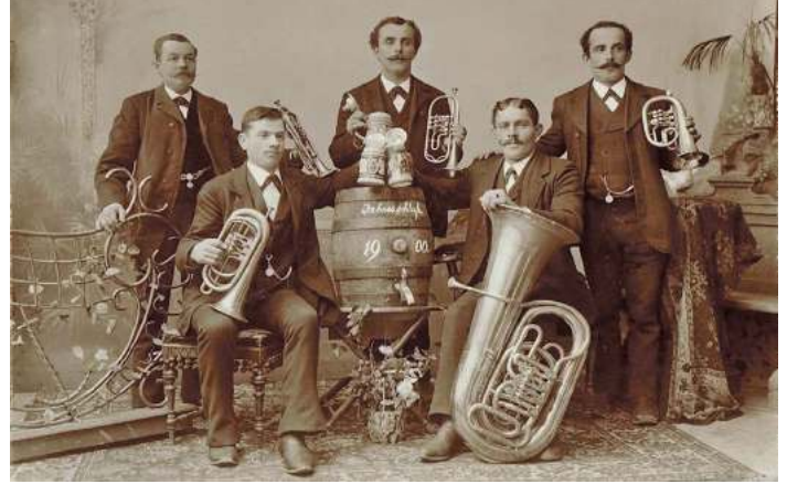
Die Musikkapelle Akams um 1900, damals wurde nicht in Tracht, sondern im Sonntagsanzug gespielt.