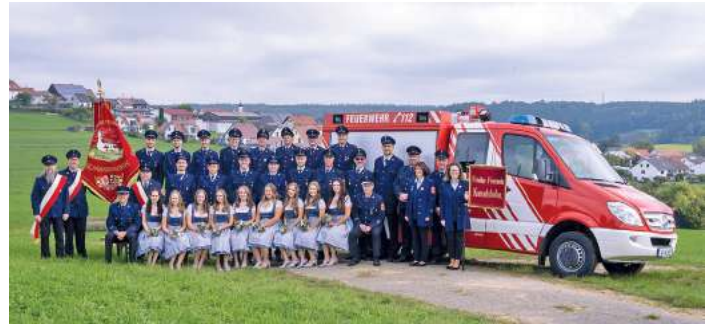
Die Freiwillige Feuerwehr Konradshofen feiert ihr 150-jähriges Vereinsjubiläum

Aber die Feuerwehr ist nicht nur eine tragende Säule der Sicherheit, sondern auch des Zusammenhalts im Dorf und somit ein wichtiger Bestandteil des gesellschaftlichen Lebens in Konradshofen. Seit 1998 ist das traditionelle Floriansfest immer an Fronleichnam ein festes Datum im Veranstaltungskalender. Gut kommt auch das gemeinsame Kochen für die Dorfgemeinschaft an, bei dem zum Beispiel leckere Göckel oder Kesselfleisch angeboten